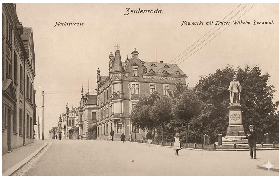
Abbildung 62: Postkarte mit Kaiser-Wilhelm-Denkmal (ca. 1900).