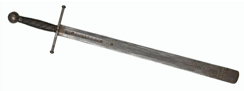
Abbildung 63: Richtschwert von Zeulenroda (zu sehen im Stadtmuseum Zeulenroda) - Autor.

Eine genaue Aufzeichnung von Urteilen und Vollstreckungen fehlt allerdings. Daher ist offen, wie aktiv und in welchem Zeitraum der Galgenberg als aktive Richtstätte genutzt wurde.