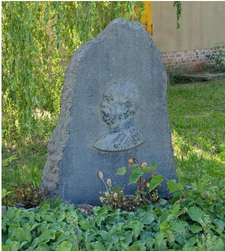
Abbildung 65: Bismarckstein in Triebes (2025) – Autor.

In Deutschland wurden besonders um die Jahrhundertwende vom 19. zum 20. Jahrhundert zahlreiche Bismarck-Denkmal errichtet, weil Otto von Bismarck als zentraler Architekt der deutschen Reichsgründung 1871 galt und als Symbol nationaler Einheit, Stärke und preußischer Disziplin verehrt wurde. Nach seinem Rücktritt 1890 entwickelte sich um seine Person fast ein Kult, der nicht nur politische, sondern auch emotionale und kulturelle Dimensionen hatte. Besonders nach seinem Tod 1898 kam es zu einer wahren Flut von Denkmal-Initiativen – nicht nur durch den Staat, sondern auch durch bürgerliche Initiativen, Studentenverbindungen und patriotische Vereine. Viele dieser Denkmäler, wie etwa die monumentalen Bismarcktürme, wurden als Ausdruck nationaler Identität und gemeinsamer deutscher Geschichte verstanden.