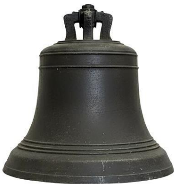
Abbildung 64: Armesünderglocke von Zeulenroda (zu sehen im Stadtmuseum Zeulenroda) - Autor.

Anders sieht es beim Flurstück Moos aus. Dieses liegt auf der anderen Seite der Stadt. Angeblich lag dort ursprünglich eine verlassene Siedlung, aber im Laufe der Zeit wurde dieser Bereich dann als Feld für den Bürgermeister und andere Bedienstete der Stadt genutzt. Unter anderem bekam auch der Scharfrichter dort ein Haus und ein Grundstück zum Bewirtschaften und es wurden in diesem Bereich auch Todesurteile vollstreckt. Dokumentiert ist der Fall der Kindesmörderin Catharina Blöttner, die an dieser Stelle enthauptet wurde.